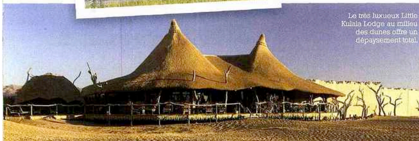
Le très luxueux Little Kulala Lodge au milieu des dunes offre un dépaysement total.