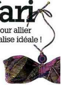
Maillot de bain imprimé exotique, C&A, haut 12,95 € et bas 9,95 €