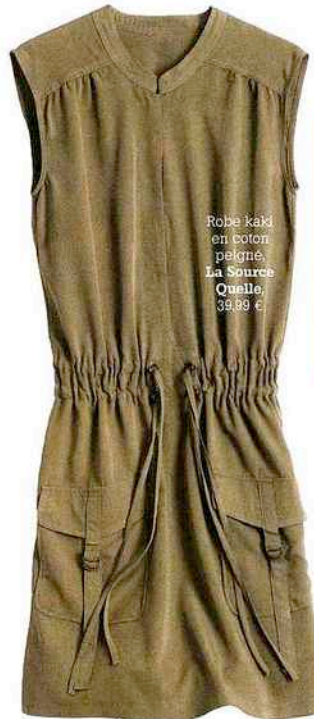
Robe kaki en Coton peigné, La Source Quille, 39,99 €

Découvrez une sélection d'indispensables pour allier confort et glamour en safari. Une idée de la valise idéale !