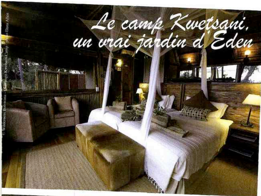
Le camp Kwetsani, un vrai jardin d'Éden

© Wilderness Botswana - Okavango Kwetsani Camp - photo Dana Allen