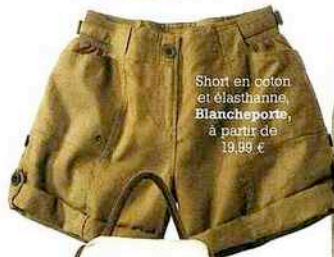
Short en coton et élasthanne, Blancheporte, à partir de 19,99 €