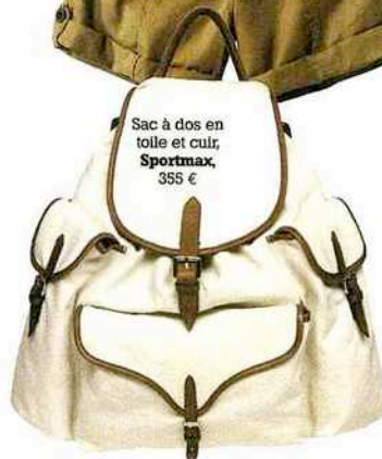
Sac à dos en toile et cuir, Sportmax, 355 €