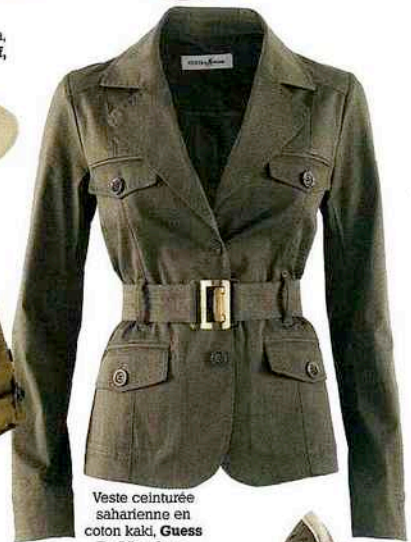
Veste ceinturée saharienne en coton kaki, Guess By Marciano, 229 €