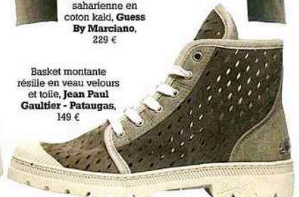
Basket montante résille en veau velours et toile, Jean Paul Gaultier - Pataugas, 149 €