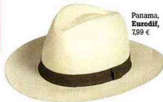
Panama, Eurodif, 7,99 €