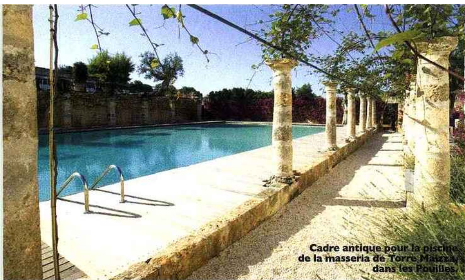
Cadre antique pour la piscine de la masseria de Torre Maizza dans les Pouilles.

Au Mas Candille aussi, on joue la carte écolo. Dans ce Relais & Châteaux, à l'orée du vieux Mougins, on utilise papier recyclé et encres végétales pour réaliser les brochures. Les équipes de l'hôtel organisent le tri des déchets, distribuent sacs à linge et produits d'accueil biodégradables et sensibilisent la clientèle au fait de se servir plus d'une seule fois des draps de bain. Même les jardiniers sont au parfum : ils boudent désormais tous les pesticides. Quant au Fronlas, au Pays de Galles, c'est